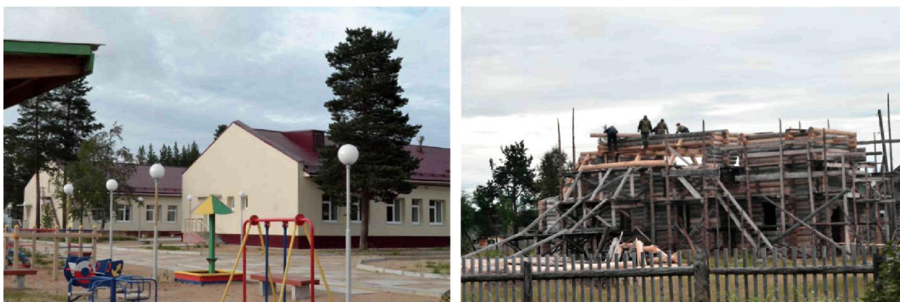
Рис. 2. Черты благополучия в селе