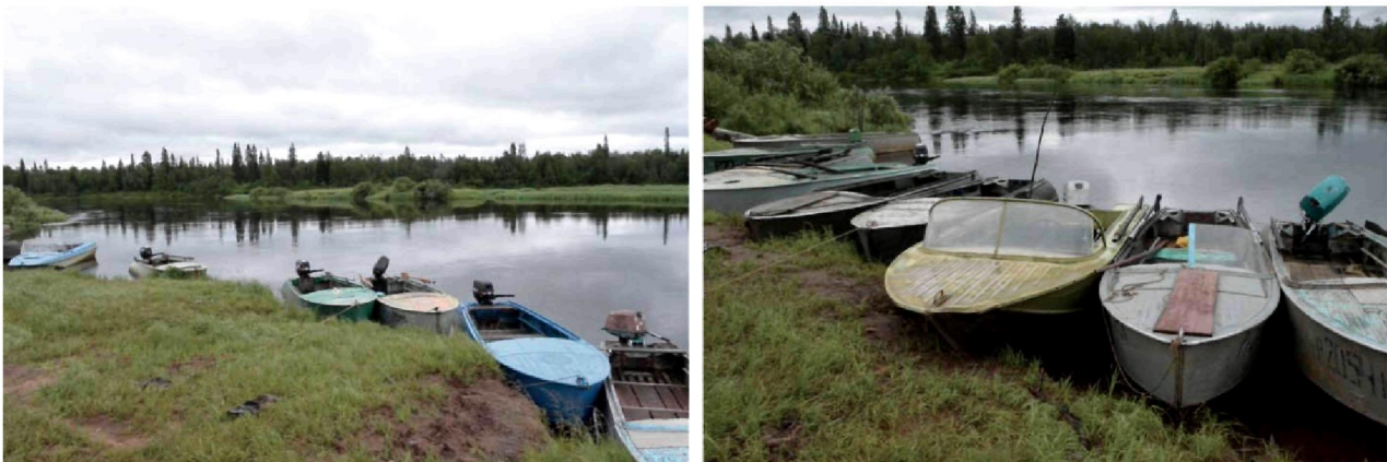
Рис. 5. На реке Поной

Проблема занятости жителей села оказалась сложной для обсуждения. Информанты неохотно разговаривали на эту тему и жаловались на то, что постоянной стабильной работы, приносящей доход, в селе не хватает. Поэтому, по их словам, значительная часть населения вынуждена заниматься временными подработками и различной инициативной деятельностью, которая помогает выживать. Важное место в такой деятельности принадлежит традиционным видам занятости коренного населения Севера: оленеводству, рыболовству и сбору ягод.