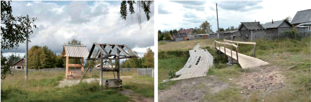
Рис. 4. Символы «старого» и «нового» в жизни села