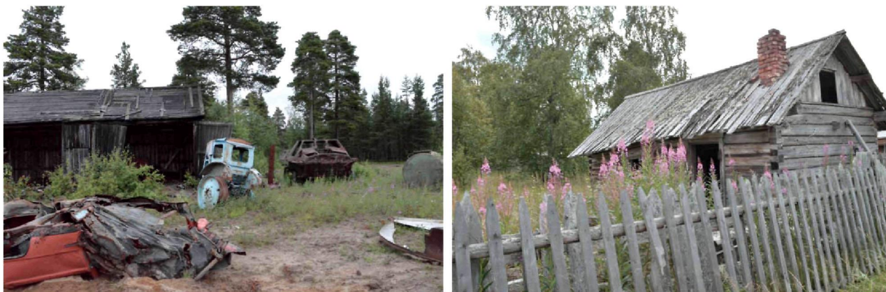
Рис. 1. Черты разрухи в селе