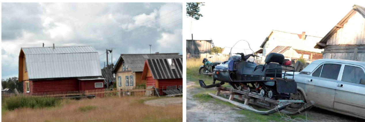
Рис. 3. Черты благополучия в селе

альному проекту строится бревенчатый православный храм (рис. 2). Работают три магазина, в которых представлен достаточно широкий ассортимент продовольственных и промышленных товаров.